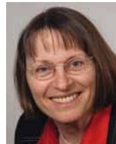
Rosalinde Kottmann Bürgermeisterin Gemeinde Gschwend